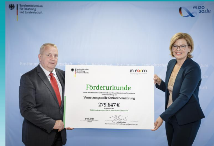
v.l.n.r. Dr. Till Backhaus, Minister für Landwirtschaft und Umwelt MV und Julia Klöckner, Bundesministerin für Ernährung und Landwirtschaft