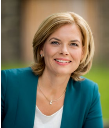
Julia Klöckner Bundesministerin für Ernährung und Landwirtschaft