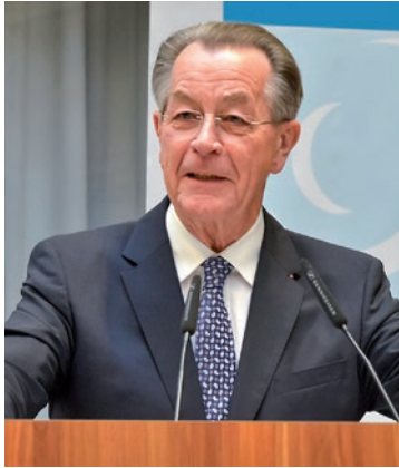
Franz Müntefering Vorsitzender der BAGSO

Wir werden relativ gesund alt. Das ist schön. Und unsere Lebenserwartung steigt stetig. Viel gutes zusätzliches Leben kommt hinzu. Aber hohes Alter bedeutet doch auch: Häufigkeit und Spektrum der Krankheiten nehmen zu, auch der Mangel an sozialen Kontakten.